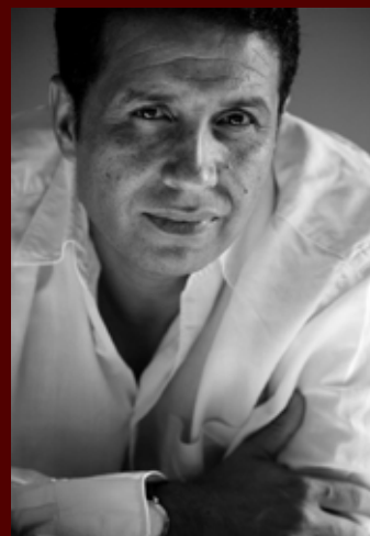
Noureddine LAKHMARI Cinéaste (Maroc)