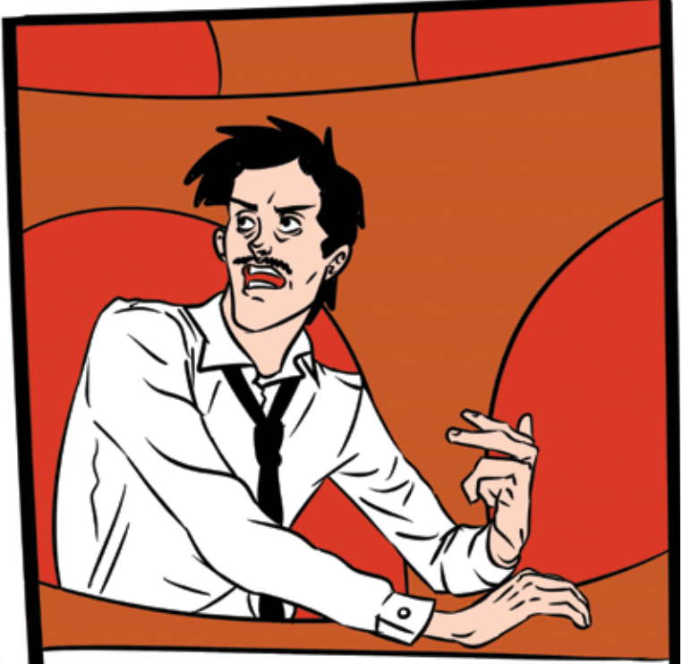
البرلماني كيعارض النقص فميزانية التعليم