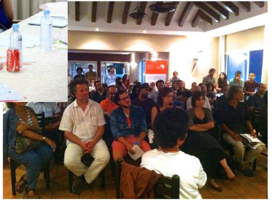
En amont des Etats Généraux de la Culture : rencontres professionnelles, rencontres régionales avec les publics, ateliers de concertation....